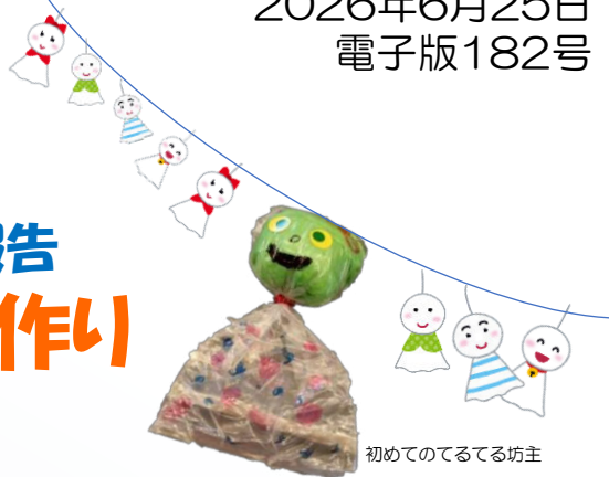
初めてのてるてる坊主