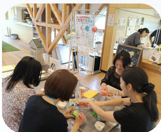
初めて“てるてる坊主”作りに挑戦！