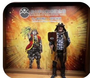
武将なりきりコーナー