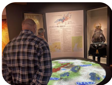
プロジェクションマッピングで戦いのようすを見られます