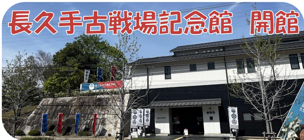
長久手古戦場記念館