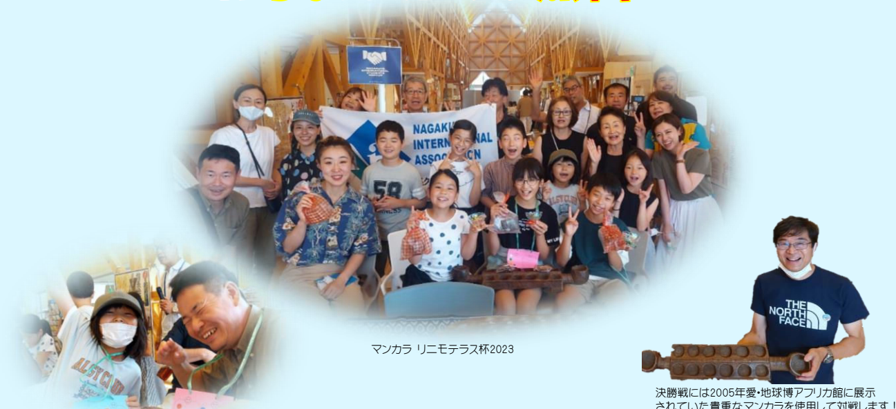
マンカラ リニモテラス杯2023