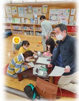
子どもを見守りながら教室活動