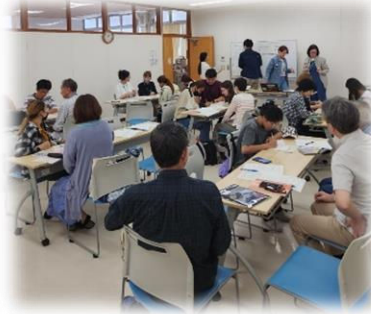
やさしい日本語に変換!

「車庫前に付き駐車ご遠慮下さい」 「線状降水帯が発生する恐れがあります」を「やさしい日本語」にしました。愛知県立大学の留学生が活動レポートを書いてくれました。