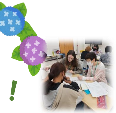
「難しいところ」を外国人に教えてもらいました