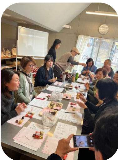
会話がはずむ交流会