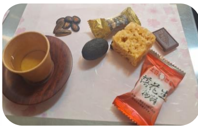
台湾のお菓子とお茶