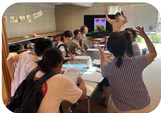
部屋いっぱい集まった参加者