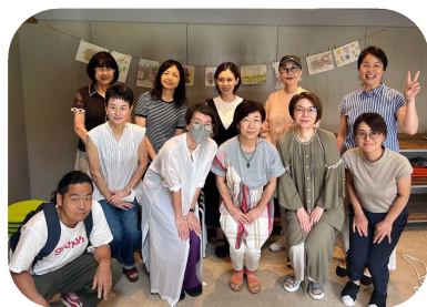
シリーズ第2回で再会を！参加者のみなさん