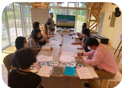
李さんの話に聞き入る参加者

みなさんは「温かい雰囲気ですっかり学べた!」と次回の開催に期待を寄せていました。