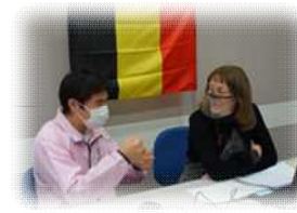
オペレーターと出演者の打ち合わせ