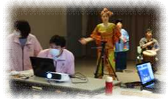
舞踊室・オペレーター