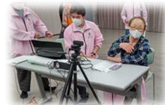
プログラムの進行を見守る