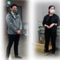
イベント会社セレスポのおふたり