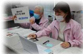
ホストコンピューター・オペレーター