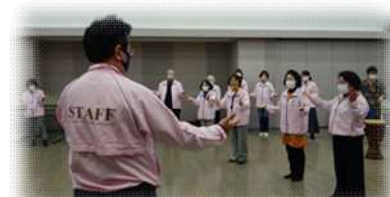
一本締め! お疲れ様でした!