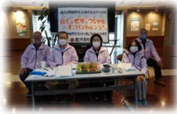
出演者受付・誘導