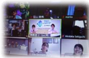
Zoomで参加のみなさん