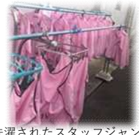
洗濯されたスタッフジャンパー