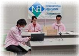
午前・午後の総合司会者とオペレーター