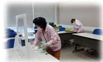
コロナ感染対策チーム