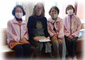
コロナ感染対策の合間には出演者との交流も